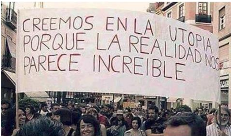
(intro en la imagen)